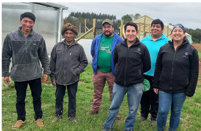
Asociación de Agricultores Jóvenes Wallung.

La tentación de transferir ciertos saberes y formas de hacer asociados a sistemas de significación propios de los agentes del desarrollo hacia poblaciones con sistemas de significación diferentes conlleva que los “conocimientos locales” queden subordinados y/o relegados por el conocimiento tecnocientífico y la cultura profesional de las instituciones que impulsan las intervenciones.